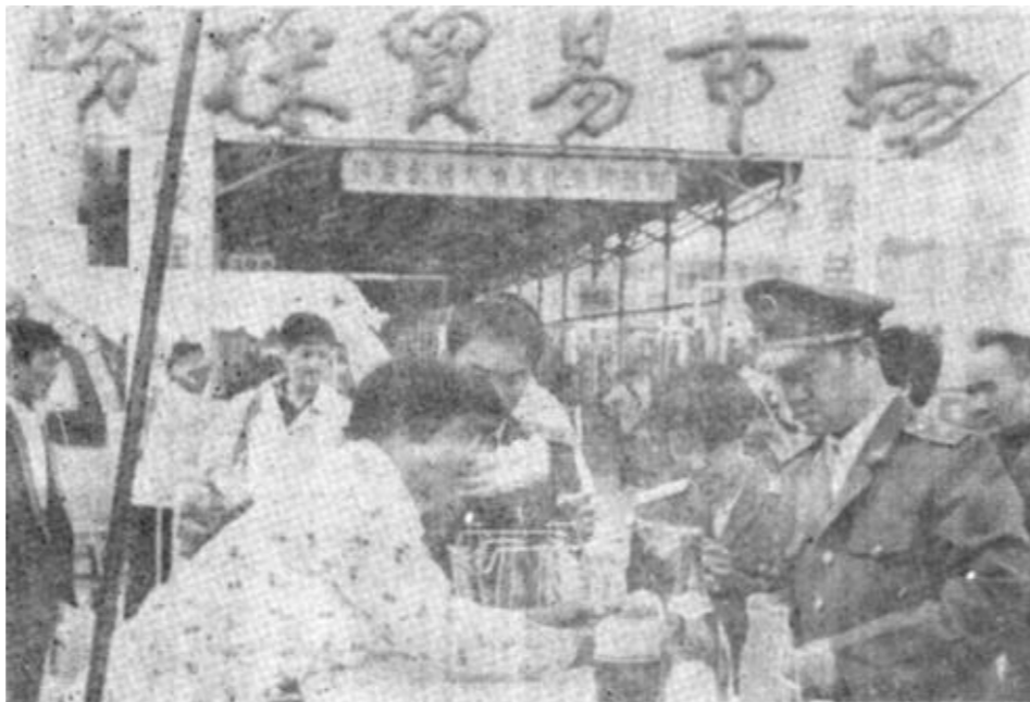
夏季到来之际，东营区工商分局采油市场管理所对辖区各小吃、副食摊点卫生防蝇设施进行突击检查，对不符合规定的限期改正。

本报讯 近日，市消防局、劳动局、经委等部门联合组成检查组，对全市27家商场、宾馆、游艺娱乐场所进行了检查。